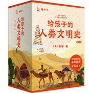
给孩子的人类文明史